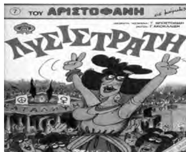
Εκδοτική επιτυχία πρώτου μεγέθους αποτελούν οι κωμωδίες του Αριστοφάνη σε κόμικς (διασκευή-κείμενα: Τ. Αποστολίδη, σκίτσα: Γ. Ακοκαλίδη).