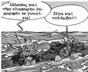
Τα κείμενα του Αστεριξ στην ιστορία «Μεταξύ Ρόδου και Ξίφους» μετέγραψε στην Αρχαία Ελληνική ο καθηγητής Φ.Ι. Κακριδής.

Τέλος, οι μαθητές μπορούν να ερωτηθούν αν διαβάζουν κόμικς στα αρχαία ελληνικά, π.χ. Αστεριξ. Θα ήταν ενδιαφέρον να υπάρχουν τα τεύχη στην τάξη για να τα ξεφυλλίσουν. Επίσης, οι κωμωδίες του Αριστοφάνη κυκλοφορούν διασκευασμένες με τη μορφή κόμικς.